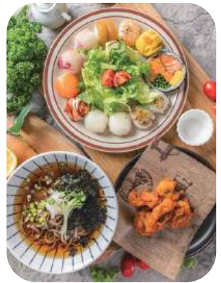
1인 황제세트 Emperor Set 25,000