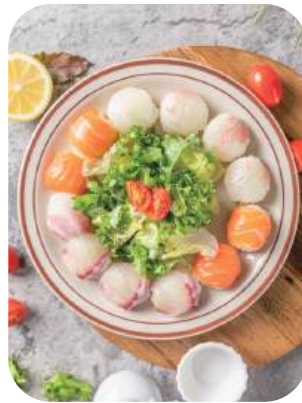
트리플초밥(12p) Triple Sushi 21,000