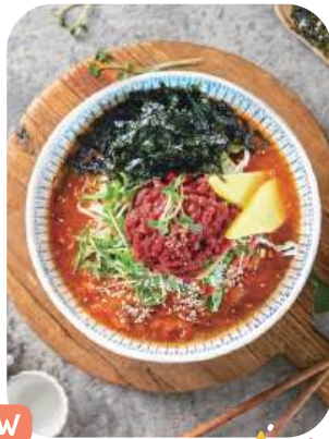
육회냉면 Spicy Sashimi Bibimbap 14,000