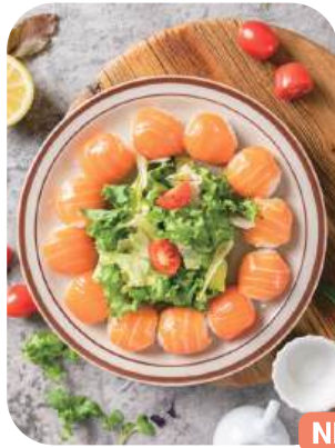
연어초밥(12p) Salmon Sushi 21,000