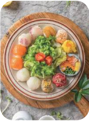
모듬초밥(12p) Assorted Sushi 17,000