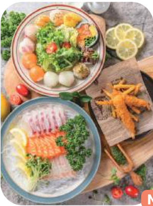
시그니처세트 A Signature Set 57,000