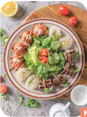
그릴초밥(12p) Grilled Sushi 19,000