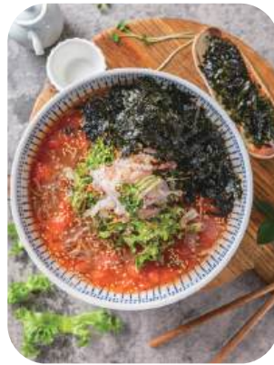
물회냉면 Mulhoe Naengmyeon 13,000