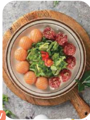
우연이초밥(12p) Beef Tartare & Salmon Duo 21,000