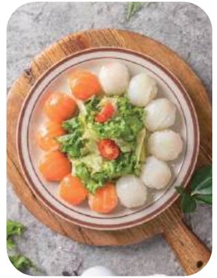
광연이초밥(12p) Salmon & Halibut Sushi Duo 21,000