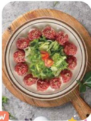
육회초밥(12p) Beef Tartare Sushi 21,000