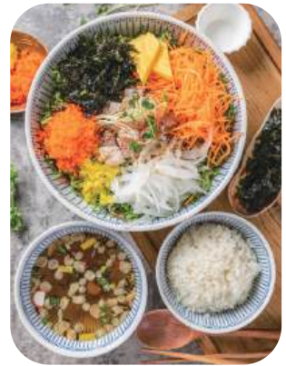
회덮밥 Spicy Sashimi Bibimbap 13,000

초밥(12p), 사시미 메뉴를 매장에서 식사하시는 경우 미니 냉모밀 or 미니 어묵우동 을 서비스로 드립니다.